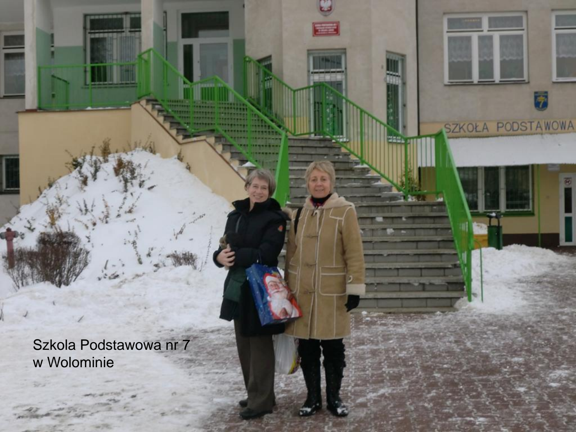
Szkola Podstawowa nr 7 w Wolominie