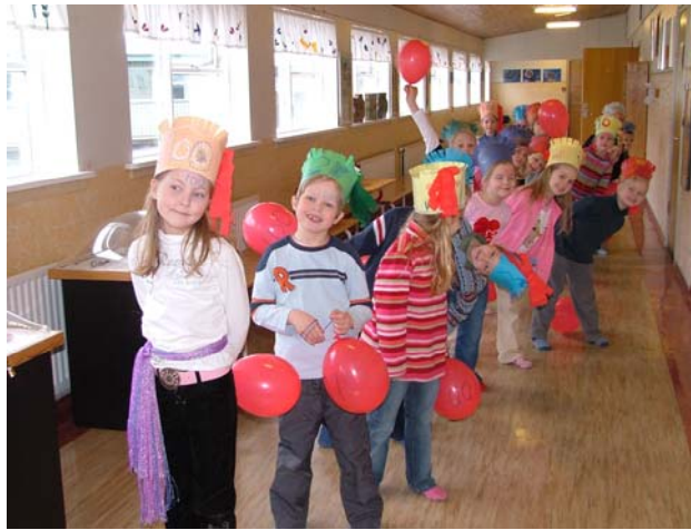
Nemendur í 1. bekk