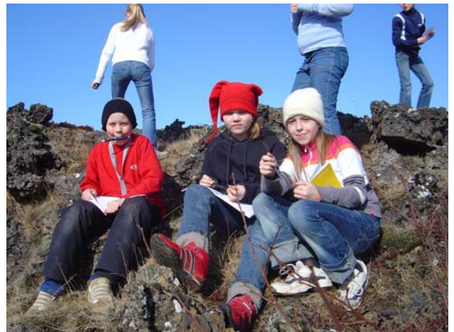
Úti í náttúrunni