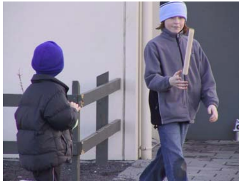
Þemadagar í Flataskóla

Seinna þemað var unnið fyrri hluta dagana 12.-14.apríl. Það hét Villidýr á veiðum og var skipulagning þess með svipuðu sniði og Ólympíuleikarnir árið áður. Þar var öllum árgöngum skipt niður í hópa, sem nefndir voru eftir dýrum. Var þetta keppni milli hópanna og endaði með miklu balli á sal skólans þar sem nemendur fengu tækifæri til að dansa og skemmta sér.