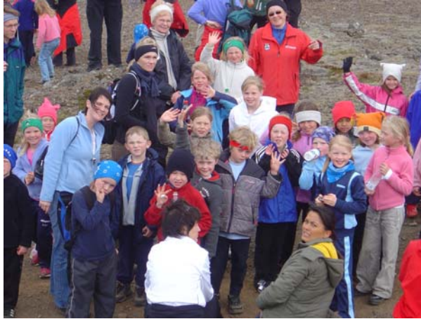
Útivistardagar í júní