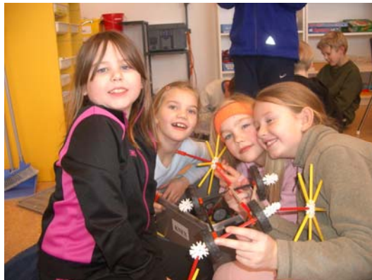
Í stærðfræðistofu hjá 3. bekk